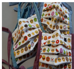
Lustige und bunte Masken machen gute Laune

Evangelische Kirchengemeinde Langerfeld und Quartiersbüro Tuhuus in Langerfeld