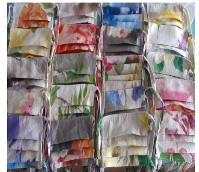
Masken müssen nicht Langweilig sein.

Ich sehe, wie viele helfen, sich engagieren und aktiv werden und das stimmt mich positiv.