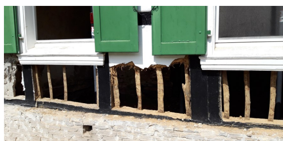
Text und Bilder: Birge Reinhoff

Mitte August gab es zwei "Tage der offenen Fenster", mit denen die Bewohner Alt-Beyenburgs gezielt dazu eingeladen haben, sich von der Lage vor Ort ein Bild zu machen und mit Betroffenen ins Gespräch zu kommen. Manchmal sind es vermeintliche Kleinigkeiten, die einem in solchen Gesprächen ans Herz gehen. "Da will man in alter Gewohnheit nach einem Stift greifen und dann fällt einem ein, dass der Schrank ja gar nicht mehr da ist, auf dem der Stift immer gelegen hat", sagte Sasha, während er in dem steht, was von seinem Erdgeschoss übrig geblieben ist. In anderen Gesprächen kommt immer wieder die Wut darüber zum Ausdruck, dass Warnungen und Hilfe zu spät oder gar nicht kamen.