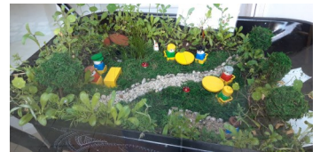
Vorschlag der AG "Langerfeld blüht auf"

Die Wiese gegenüber des Gemeindehauses Inselstraße soll zu einem Garten der Begegnung werden. Um dort Jung und Alt zusammenzubringen sollten in einem Wettbewerb Vorschläge für die Gestaltung im Miniaturformat in Schubkarren gepflanzt werden. Diese werden vom 13.-17.09. auf der Wiese aufgestellt, am 18.09. wird eine Jury die Ideen im Rahmen eines kleinen Festes prämiieren. Für die Umsetzung eines daraus entwickelten Gestaltungskonzeptes hofft die Kirchengemeinde auf Fördermittel und Spenden.