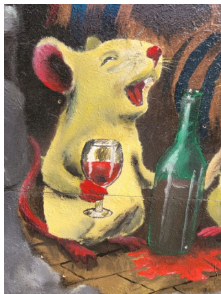
Text: Andreas Gasper/Birge Reinhoff

„Es sind ja oft Kleinigkeiten, die das Leben schön machen und vieles nimmt man im Alltag gar nicht so wirklich wahr.